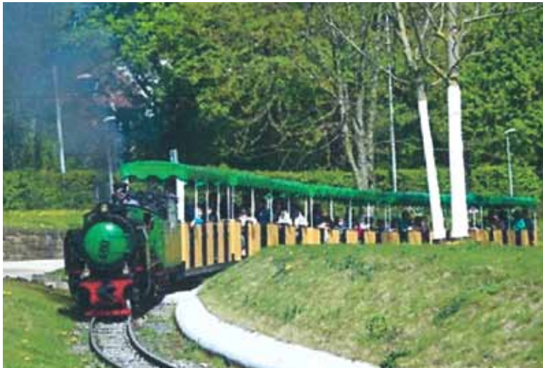
Wie die Killesberg-Bahn: immer unter Dampf.